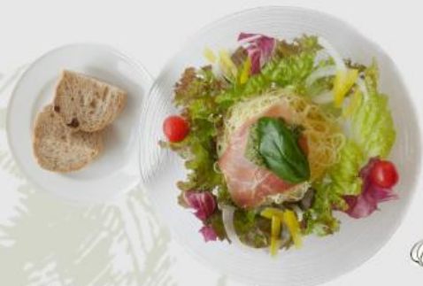
冷製パスタ (カッペリーニ)