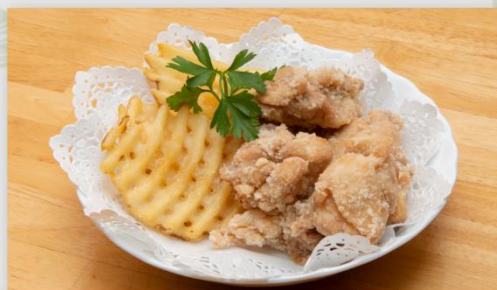
から揚げ 6個 ワッフルポテト

*お食事後のお持ち帰りは時間に余裕をもってご注文ください。 *テイクアウトメニューは、お電話でのご予約も承ります。