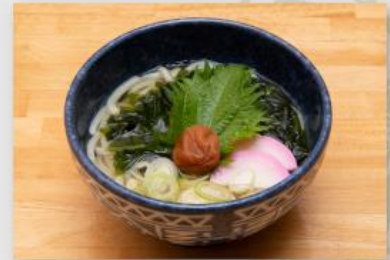
紀州梅しそわかめうどん ¥660