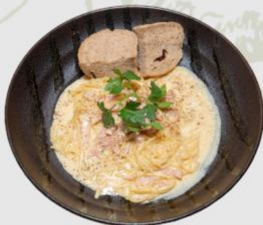
濃厚カルボナーラ