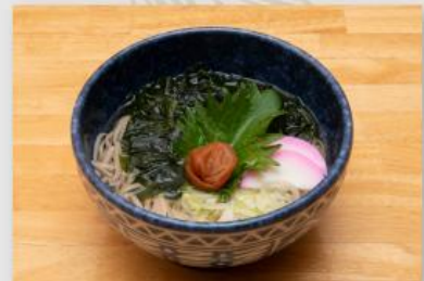
紀州梅しそわかめそば ¥660