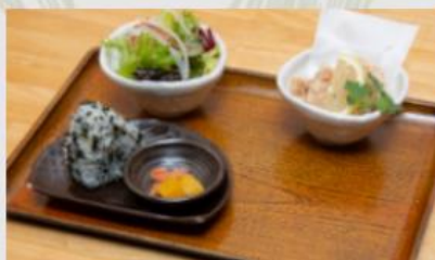
から揚げセット + ¥400