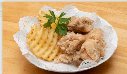
から揚げ 6個 ワッフルポテト

*お食事後のお持ち帰りは時間に余裕をもってご注文ください。 *テイクアウトメニューは、お電話でのご予約も承ります。