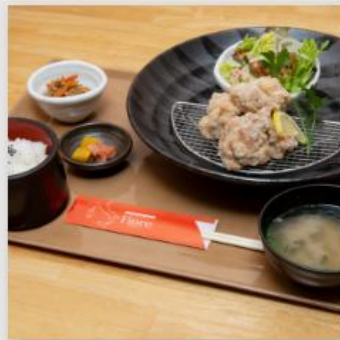
鶏のから揚げ定食 ¥950