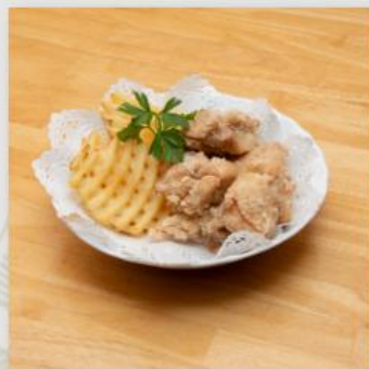
からあげ皿盛り(6個) おむすび(1個) ¥800