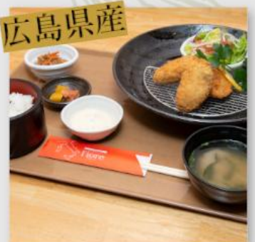
大粒カキフライ定食 ¥1,450