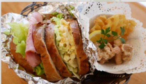
たまごサラダサンド 1個 ポークパストラミサンド 1個 から揚げ 2個 ワッフルポテト