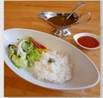
Fioreカレー ～自家製トマトソース添え～ ¥750