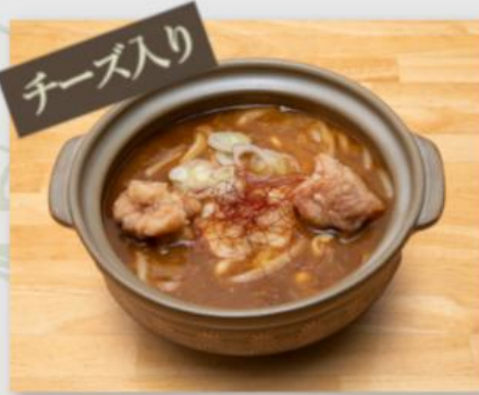
鍋焼きカレーうどん ¥950