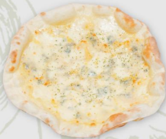
ゴルゴンゾーラ (ブルーチーズ) ¥1,400