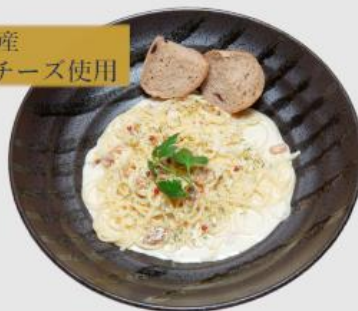
ゴルゴンゾーラ(ブルーチーズ)