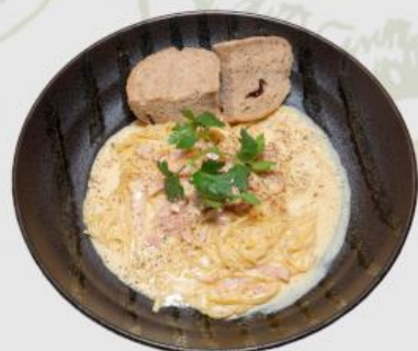
濃厚カルボナーラ