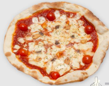
アンチョビ&トマト ¥1,250