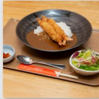
えびフライカレー ¥980