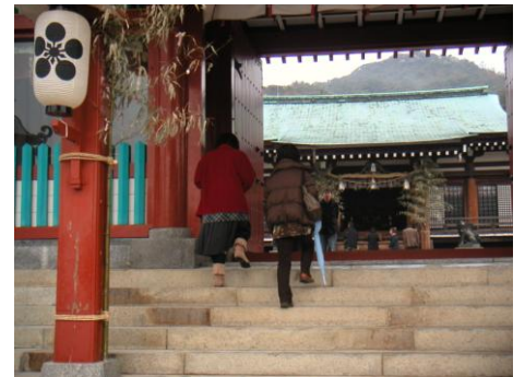
初詣に行ってきました！！